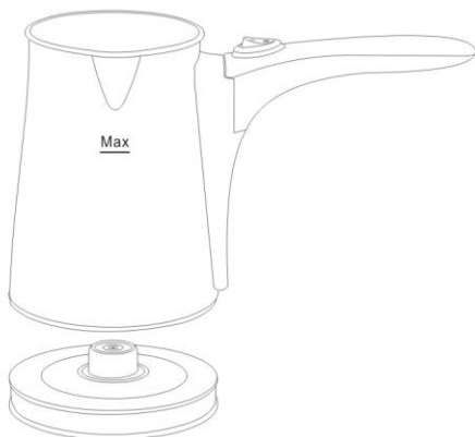
Фиг.3 Поставете съда на основата и включете