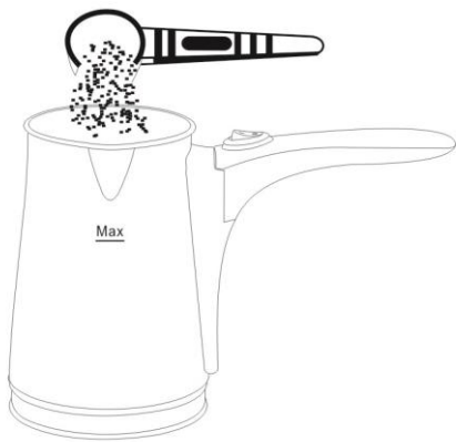
Фиг.1 Поствете кафе в съда