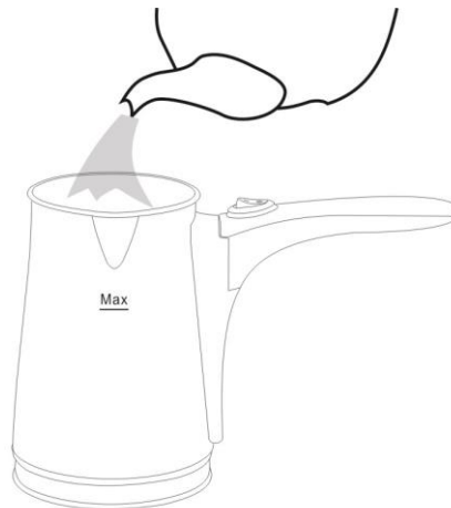
Фиг.2 Налейте вода в съда в зависимост от това колко чаши кафе ще правите (MAX 3 чаши)