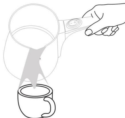
Фиг.4 Наследете се на Вашето кафе